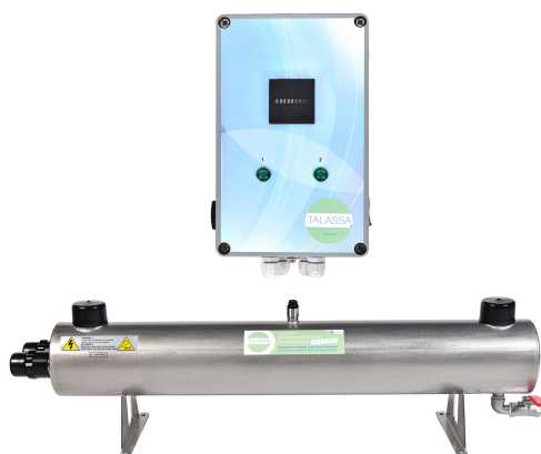
Stérilisateur UV 13 m 3 /h